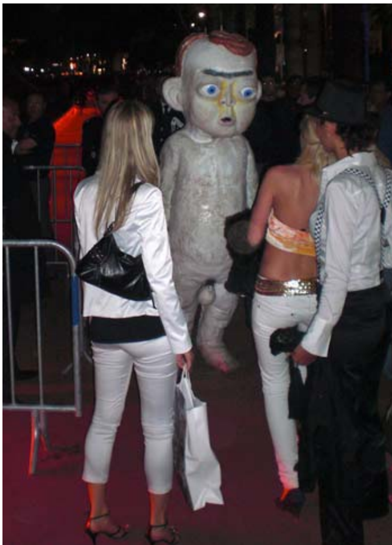
Bild: Dockpojken väcker uppseende på röda mattan på filmfestivalen i Cannes tidigare i år.

Dessutom fick alla vi som turades om att ha dräkten på oss märkliga utslag i ena knävecket, som små otäcka svampar, och säkert hundra till antalet. Det var väl någon liten ohyra som letat sig in.