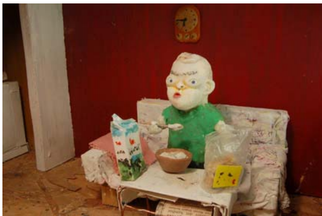
Bild: Dockpojken ur kortfilmen Sagan om den lille Dockpojken